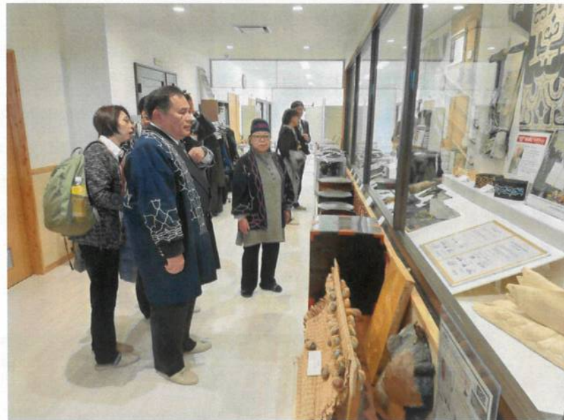
參觀白糠町愛努文化協會