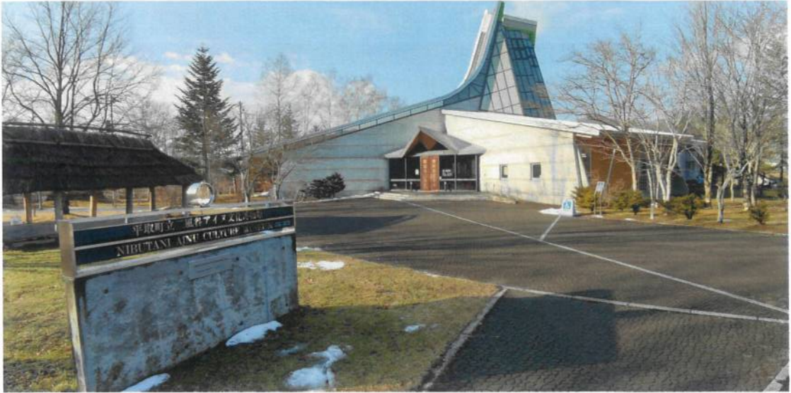
平取町二風谷愛努文化