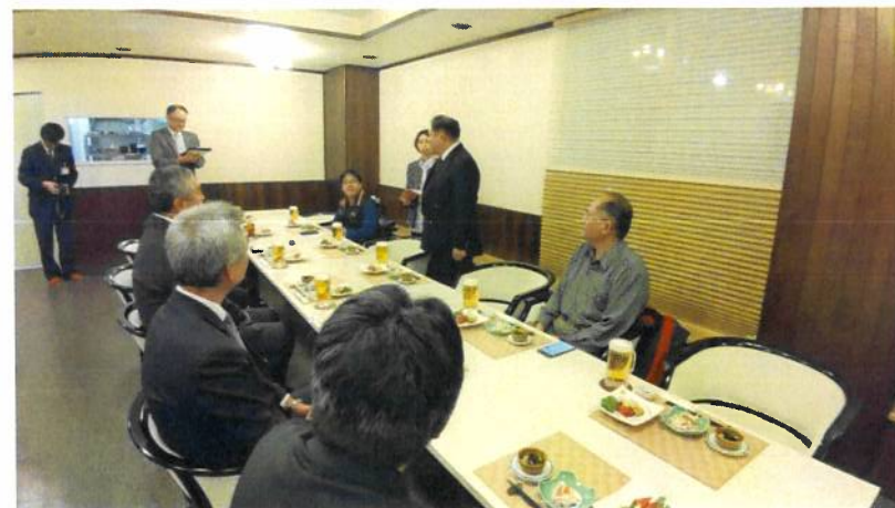
與白糠町公所召開行前會議暨晚宴招待