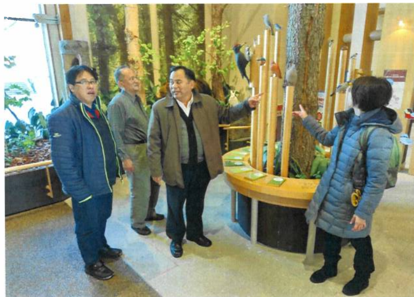
參觀支笏湖遊客中心