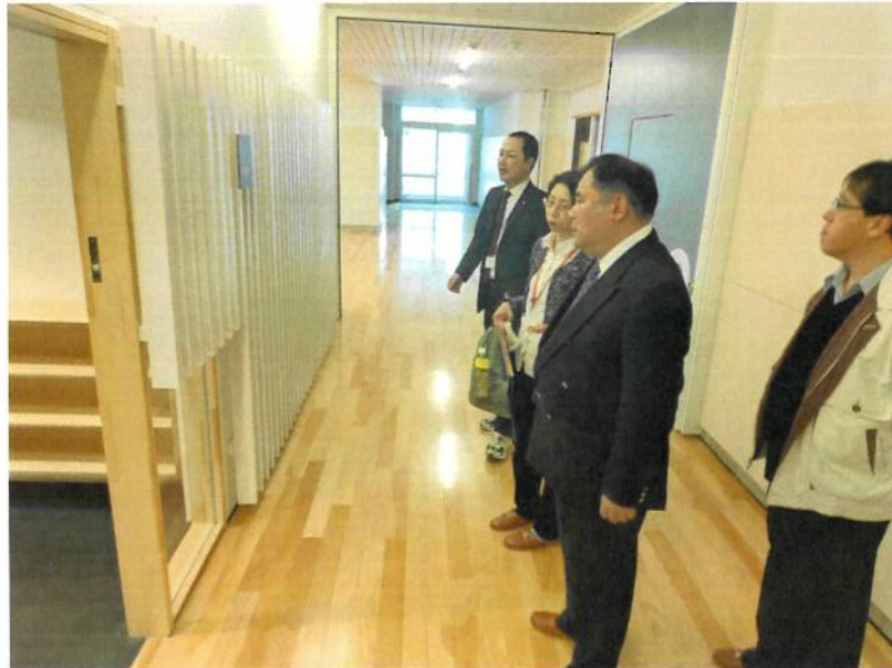
參觀庶路災害避難設施