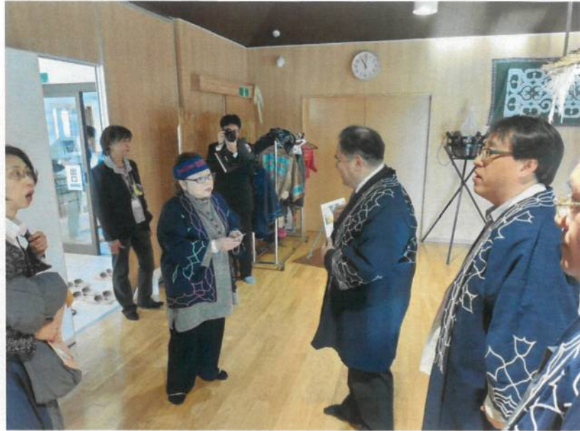
訪問白糠町愛努文化協會