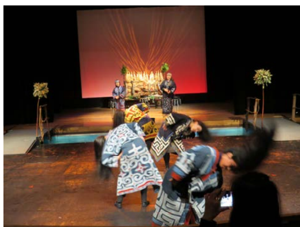
愛努族舞蹈表演(二)