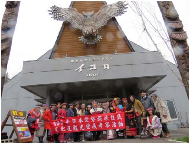
愛努族文化村伊蔻樓外合影