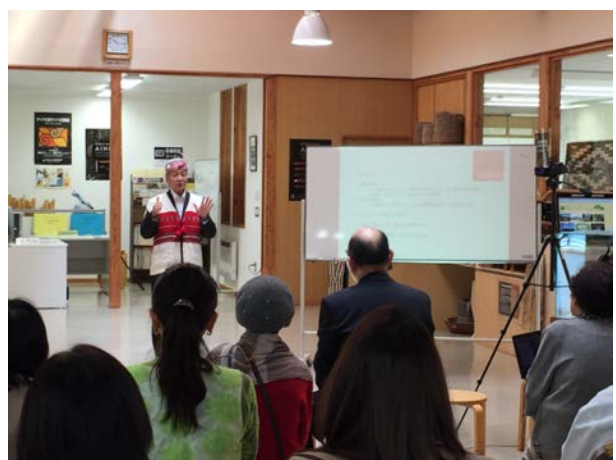
平取町二風谷工藝館交流-區長致詞