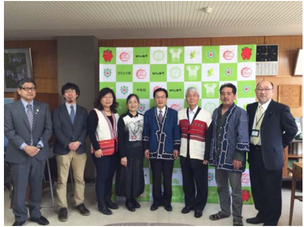
拜訪平取町公所-合影