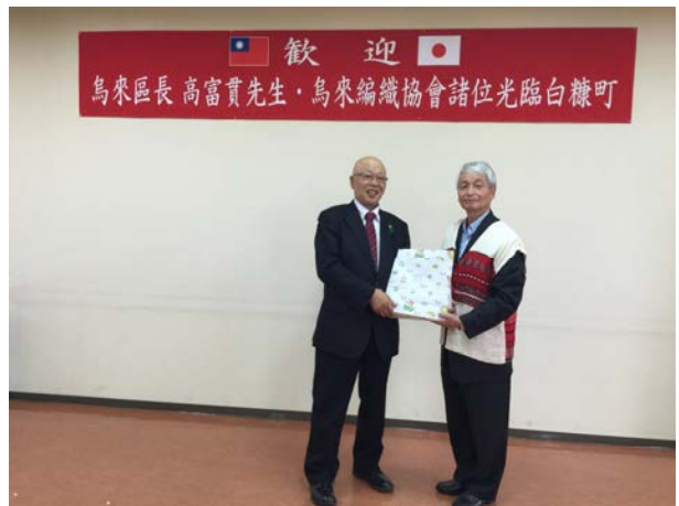
高區長與議會長丸子忠互贈紀念品