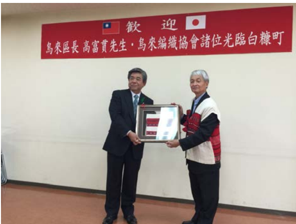
高區長與町長棚野孝夫互贈紀念品