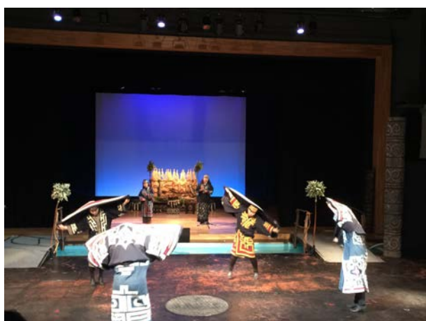
愛努族舞蹈表演(一)