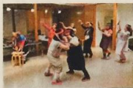
オープニングセレモニーで伝統舞踊を披露するタイヤルの女性たち

【平取】台湾の先住民族「タイヤル族」の織物作品などを展示する「台湾・烏来(ウライ)タイヤル工芸展」が18日、二風谷工芸館で始まった。初日は現地からの訪問団が伝統舞踊を披露するなどにぎわい、アイヌ民族のアットウシ(樹皮の反物)を織る二風谷地区の職人らとも交流した。