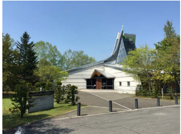
平取町立二風谷愛努族文化博物館