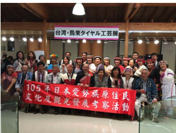
平取町二風谷工藝館交流