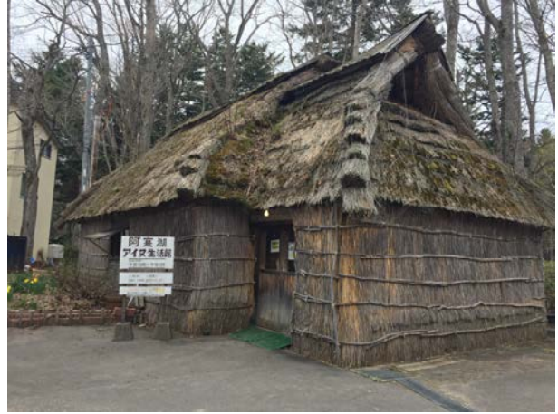
阿寒町愛努族生活館