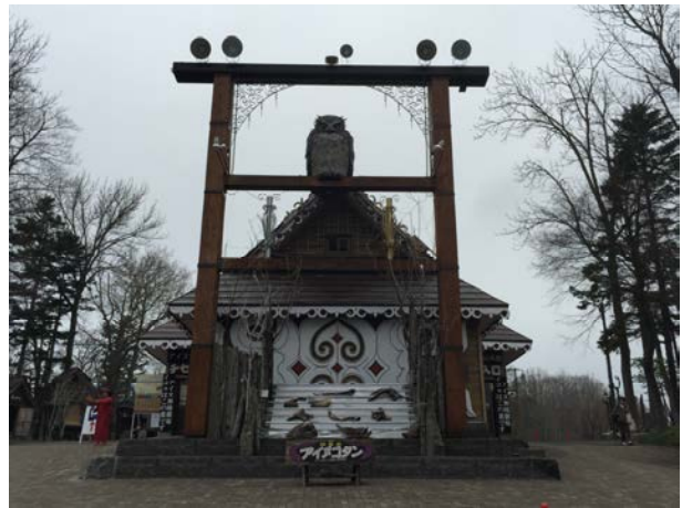
愛努族文化村文化傳承展館