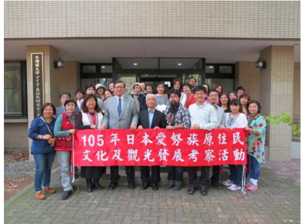
北海道大學愛努先住民研究中心前合影